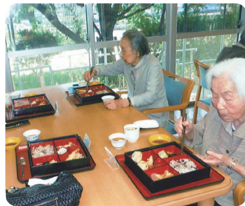
見た目も豪華で美味しい!と皆様喜ばれ、完食される方が多くおられました。赤飯が好評でした!

おやつ時間に施設長から挨拶があり、施設長へ冗談や合いの手を入れながら、笑顔で話を聞かれています。「また挨拶来てほしいわ〜」「めったに話できひんから、もっと話したい」など施設長への声が聞かれました。